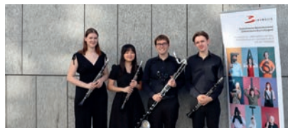
Klarmonie, Stufe D, Punkte: 89,75 TK Graz-Wetzelsdorf, MV Liebenau