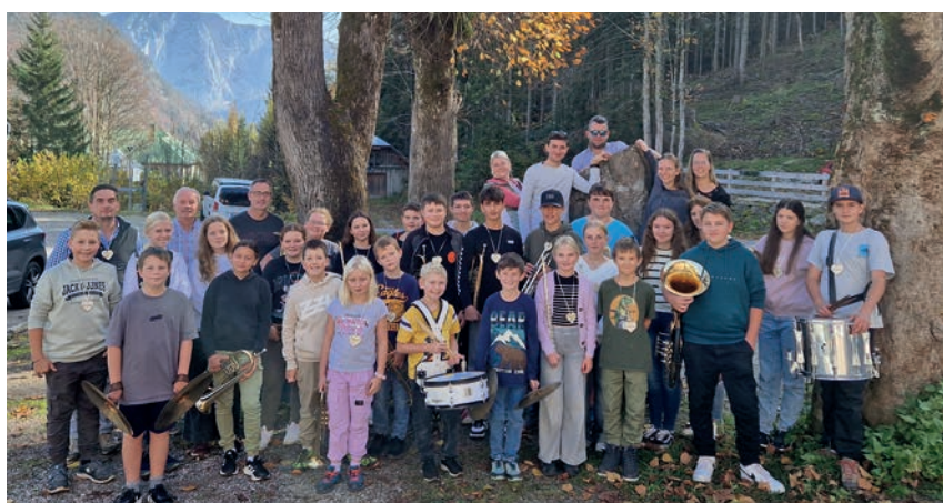
Die Teilnehmer*innen des Bezirksjugendcamps des MB Bad Aussee bei der abschließenden Marschprobe