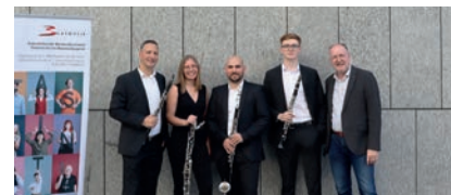
Clacardi, Stufe S, Punkte: 89,50 MMK Bad Schwanberg