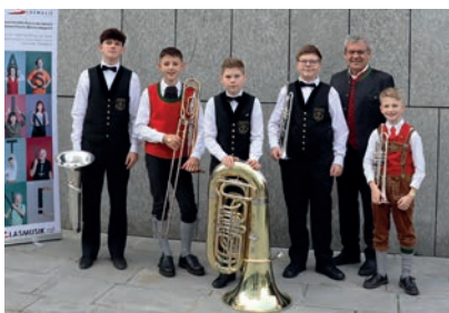
Edelmetall, Stufe A, Punkte: 88,75 Wolfram BHK St. Martin im Sulmtal, MMK Arnsfeld, MMK Wies

Aus der Steiermark haben sich fünf Ensembles qualifiziert: