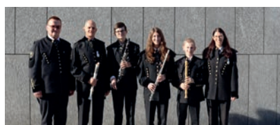
Alseto, Stufe B, Punkte: 90,50 WK Zeltweg