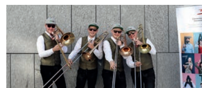
Trombo Combo, Stufe D, Punkte: 90,50 TK St. Gallen